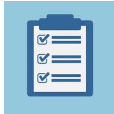
Структура образовательной программы