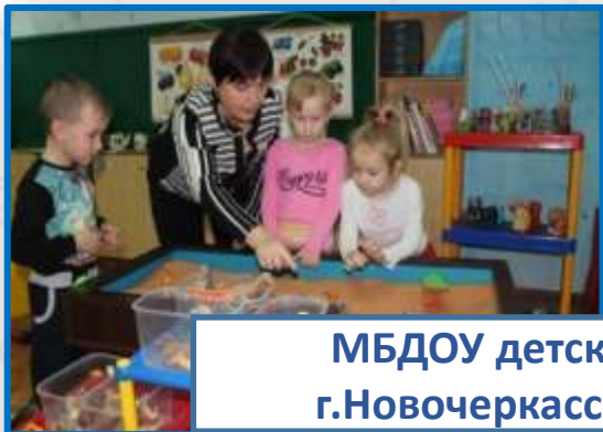
МБДОУ детский сад г.Новочеркасска №37