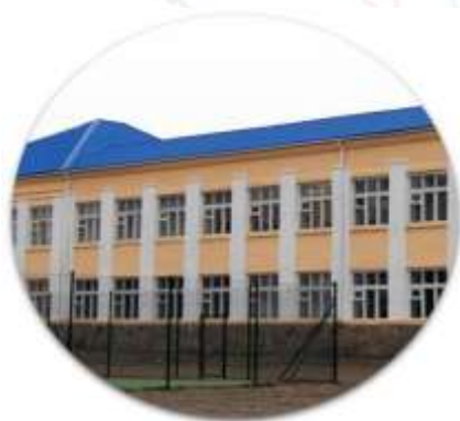
МБОУ Обливская СОШ №1