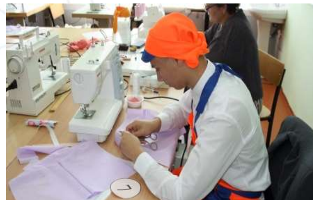
«ШВЕЙНОЕ ДЕЛО И ТЕХНОЛОГИЯ МОДЫ»