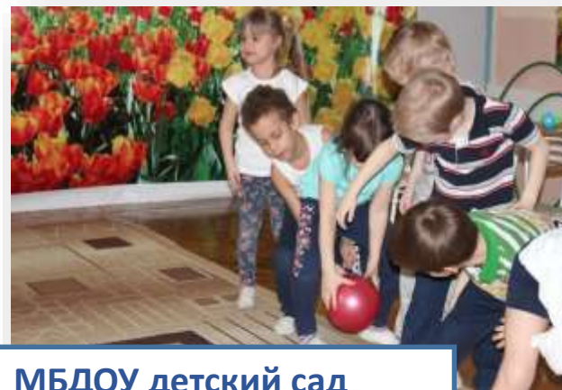
МБДОУ детский сад г.Ростова-на-Дону №138