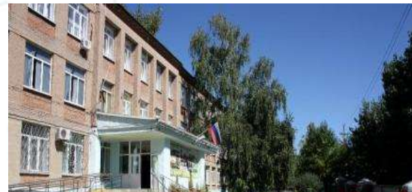
ГКОУ РО Шахтинская специальная школа-интернат №16