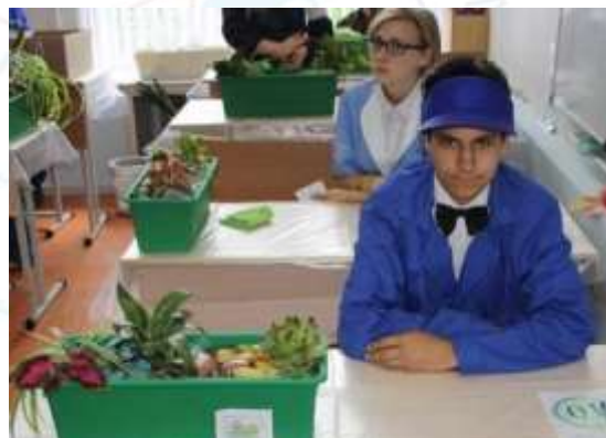
«РАСТЕНИЕВОДСТВО И ЛАНДШАФТНЫЙ ДИЗАЙН»