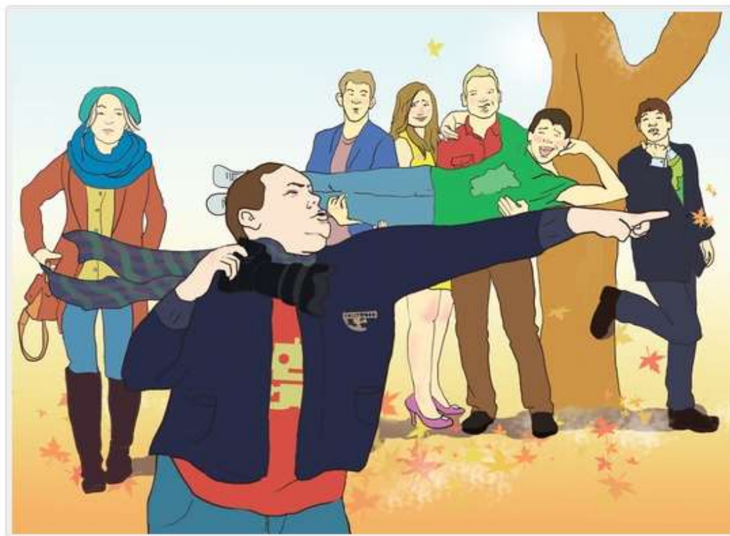
Рисунок Ирины Ериловой

Белгородская школьница о фотосессиях для выпускных альбомов