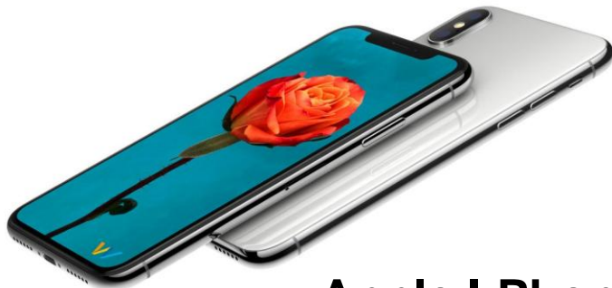
Apple I-Phone X