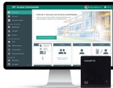
2N® Access Commander Box