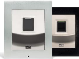
2N® Access Unit Fingerprint