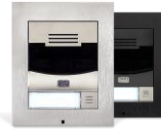
2N® IP Solo