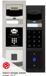
2N® IP Verso