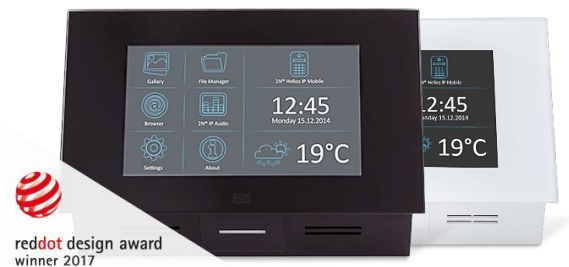
2N® Indoor Touch