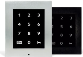
2N® Access Unit Touch Keypad