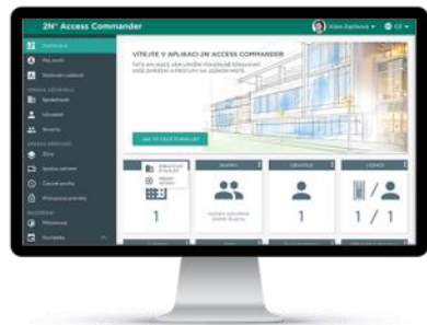
2N® Access Commander