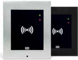
2N® Access Unit RFID