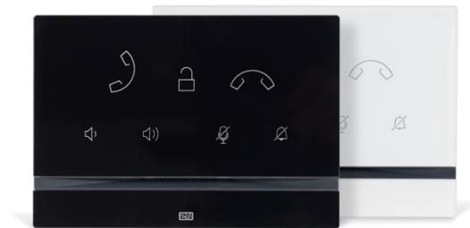
2N® Indoor Talk