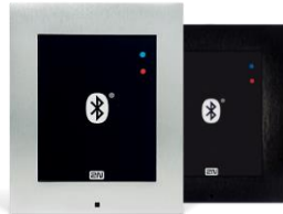
2N® Access Unit Bluetooth